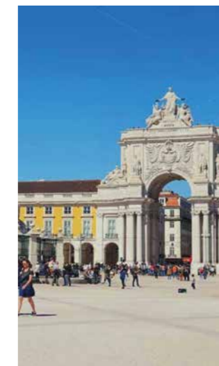
Praca de Comercio, Lissabon