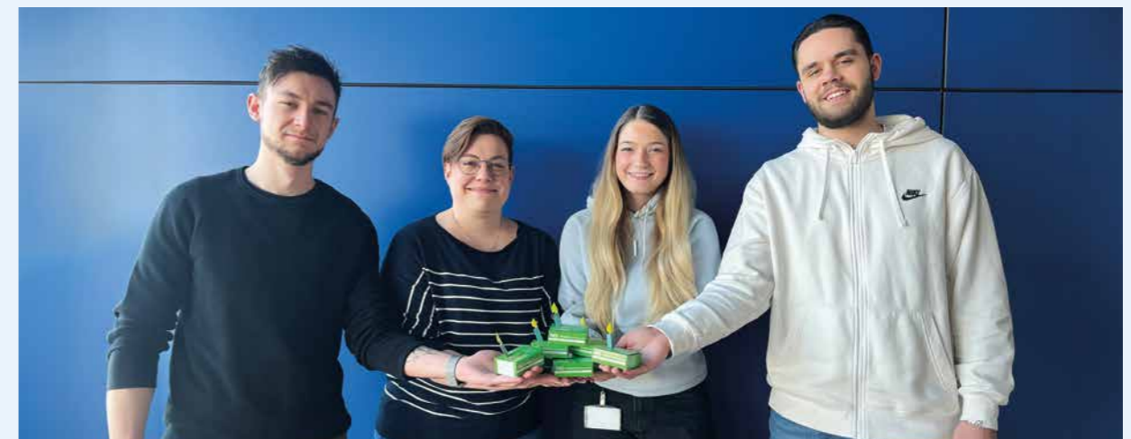
Streck-Mitarbeiterinnen und -Mitarbeiter aus den Nationalen Landverkehren in Freiburg gratulieren herzlich zum ersten Geburtstag von NG.network