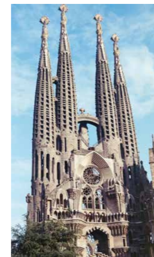
Sagrada Família, Barcelona