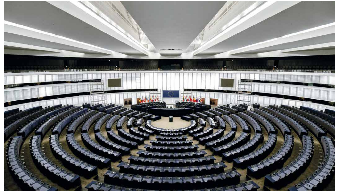
Blick in den Plenarsaal des europäischen Parlaments in Straßburg