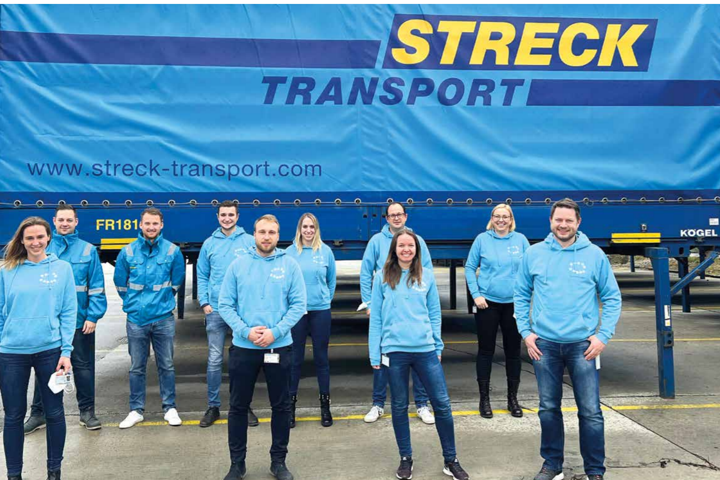
Das CargoSuite-Projektteam nach der erfolgreichen Einführung in Möhlin